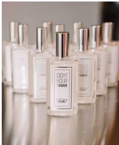
DUFTPARTNER. Exklusive Düfte gab es in den Goodie Bags von DOMI sense.