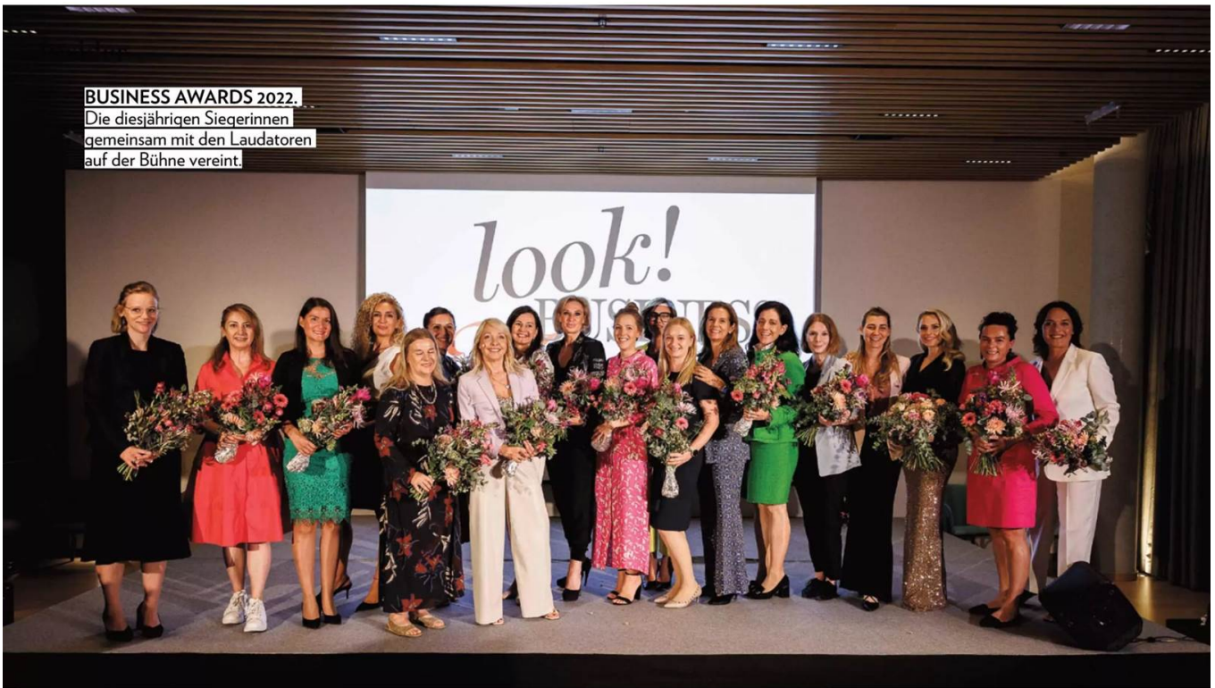
BUSINESS AWARDS 2022. Die diesjährigen Siegerinnen gemeinsam mit den Laudatoren auf der Bühne vereint.