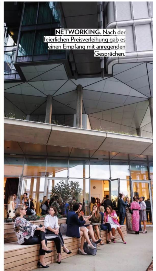
NETWORKING. Nach der feierlichen Preisverleihung gab es einen Empfang mit anregenden Gesprächen.