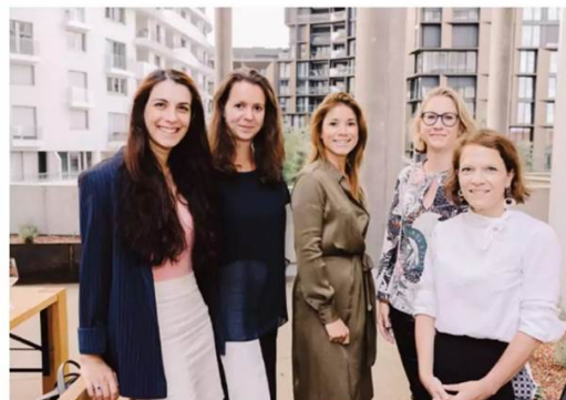
DAMENRUNDE. Bestens gelaunt zeigten sich die Business-Ladys der IWF-Mentorinnengruppe.