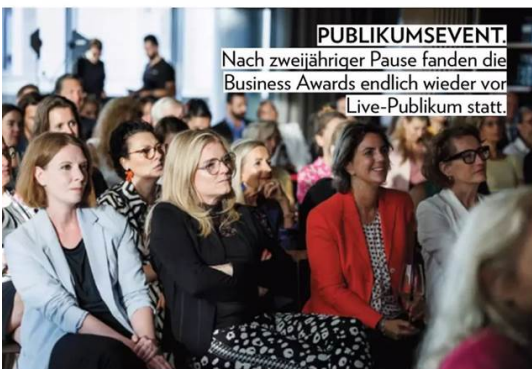
PUBLIKUMSEVENT. Nach zweijähriger Pause fanden die Business Awards endlich wieder vor Live-Publikum statt.